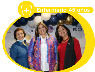
Enfermería 45 años